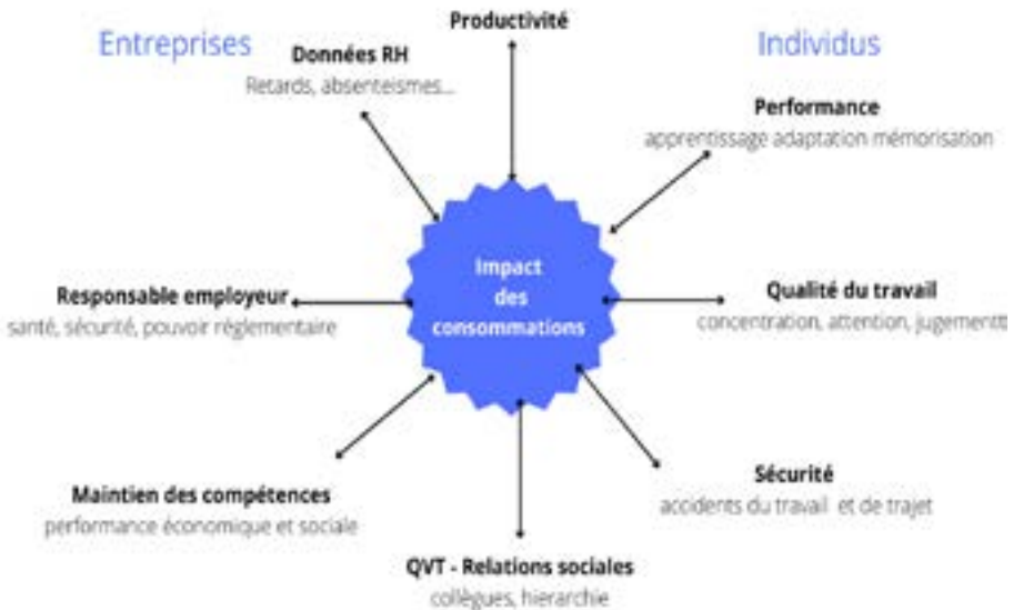
Schéma sur les conséquences des consommations de substances psychoactives pour le collaborateur et l'entreprise (Inserm, OFDT, Constances,

Une démarche globale de prévention qui prend en compte l'organisation du travail demande un investissement dans le temps mais reste la plus efficace à long terme.